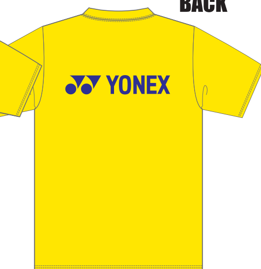
フラッシュイエロー (557)